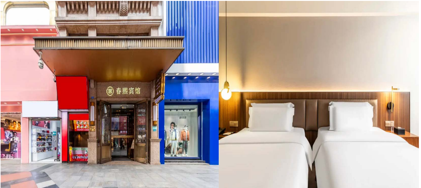
โรงแรมใจกลางย่านช้อปปิ้งชุนซีลู่

Cheangdu Chunxi Hotel ย่านช้อปปิ้งชุนซีลู่ หรือระดับเทียบเท่า พักห้องละ 2-3 ท่าน หมายเหตุ โรงแรมที่พัก จะแจ้งให้ท่านทราบ ก่อนเดินทางโดยประมาณ 5-7 วันทำการ