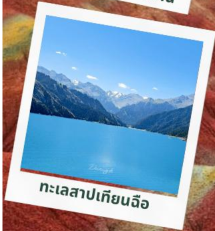
ทะเลสาปเทียนฉือ