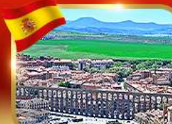
เที่ยวเมืองมรดกโลก เซโกเวีย