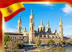
วิหารพระแม่มารีย์ ซาราโกซา