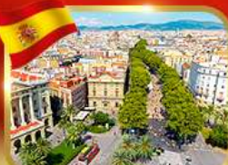
ลารัมบลาสตริก บาร์เซโลนา