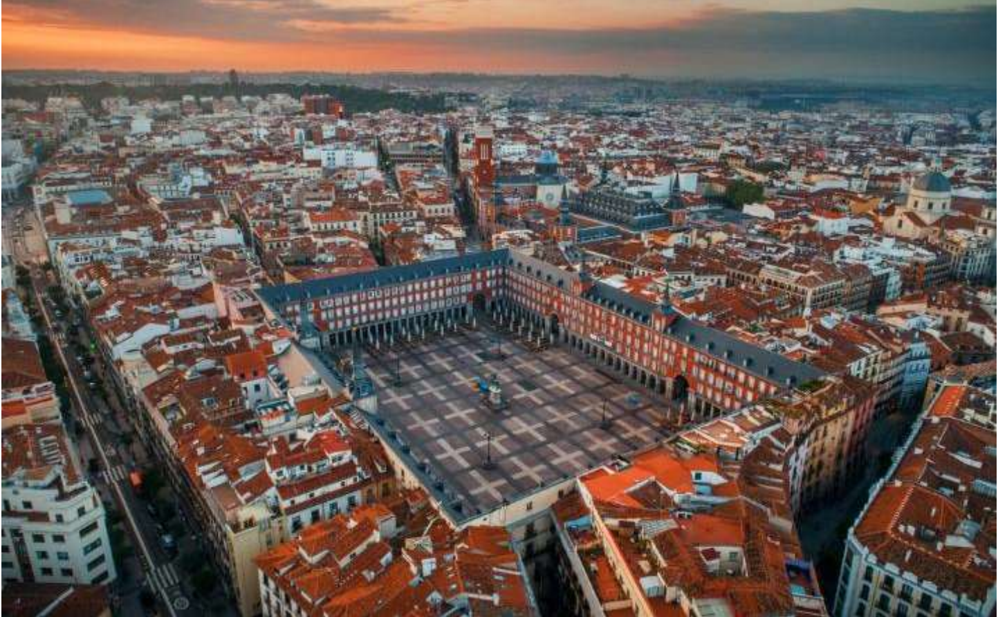
เย็น รับประทานอาหารเย็น ณ ภัตตาคาร

อิสระทุกท่านที่ จัตุรัสพลาซา มายอร์ (Plaza Mayor) จัตุรัสประวัติศาสตร์ใจกลางกรุงมาดริด สร้างขึ้นในคริสต์ศตวรรษที่ 17 เคยใช้เป็นสถานที่จัดพระราชพิธี งานเฉลิมฉลอง และกิจกรรมสำคัญของเมืองในอดีต ปัจจุบันเป็นจุดศูนย์รวมของชีวิตชาวมาดริดและนักท่องเที่ยว จัตุรัสแห่งนี้รายล้อมด้วยอาคารสถาปัตยกรรมสเปนดั้งเดิมโดดเด่นด้วยระเบียงและซุ้มโค้งอันเป็นเอกลักษณ์ บรรยากาศคลาสสิกและคึกคัก เหมาะแก่การเดินเล่น พักผ่อน อีกทั้งบริเวณโดยรอบรายล้อมด้วยร้านอาหาร คาเฟ่ และ ร้านค้าของที่ระลึก จำหน่ายสินค้าพื้นเมือง งานหัตถศิลป์ ของฝาก และสินค้าที่สะท้อนเอกลักษณ์ของสเปน อีกทั้งยังเชื่อมต่อกับถนนสายช้อปปิ้งในย่านเมืองเก่า ให้ท่านอิสระเดินเล่นเลือกซื้อสินค้า และถ่ายภาพท่ามกลางบรรยากาศคลาสสิกอันมีเสน่ห์ของกรุงมาดริด