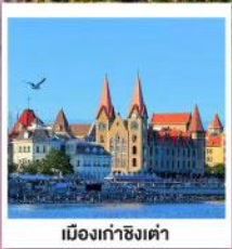
เมืองท่าชิงเต่า