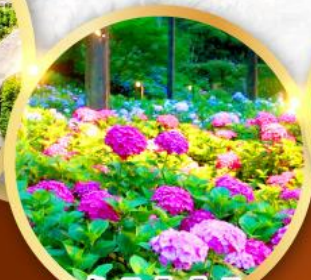
วัดมิมุโระโทจิ