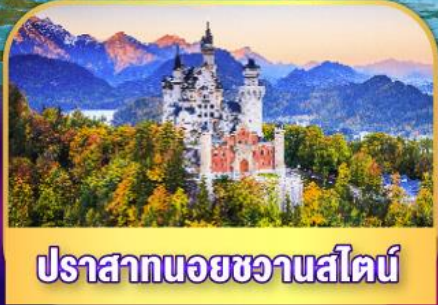
ปราสาทนอยชวานส์ไตน์