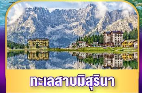
ทะเลสาบมิสุรีนา