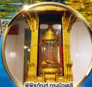
พิพิธภัณฑ์ กรุงนิวเดลี กราบมัสการพระบรมสารีริกธาตุ