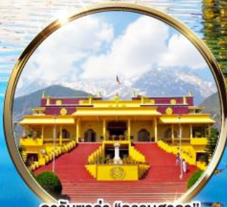
ดาริมซาล่า "ธรรมศาลา" ตำหนักองค์ดาไลลามะ