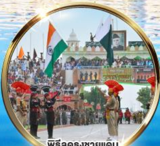
พิธีลดธงชาติ อินเดีย-ปากีสถาน ผ่านวาทะ