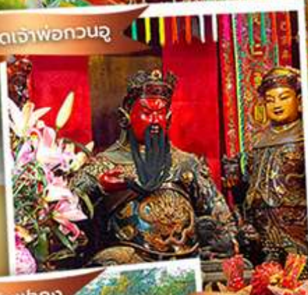
วัดหลินฟาง