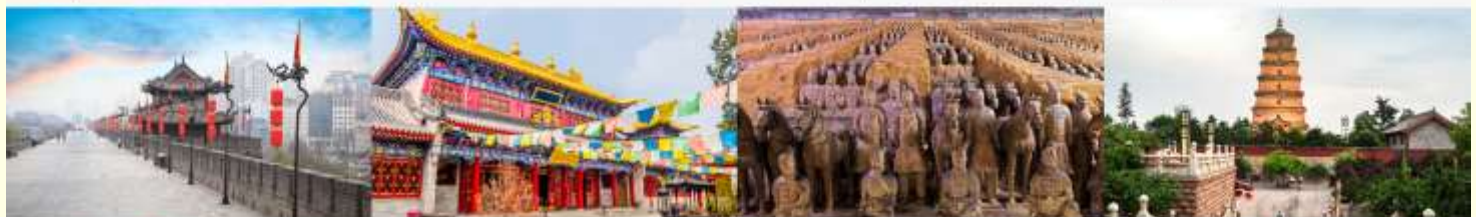
กำแพงเมืองโบราณ