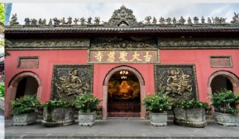
วัดต้าเจ้อ

*ทางบริษัทฯ ขอสงวนสิทธิ์ในการสลับโปรแกรมทัวร์ตามความเหมาะสมขึ้นอยู่กับสถานการณ์หน้างาน โดยคำนึงถึงผลประโยชน์ของลูกค้าเป็นสำคัญ