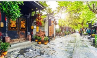
ซอยกว้างชอยแคบ