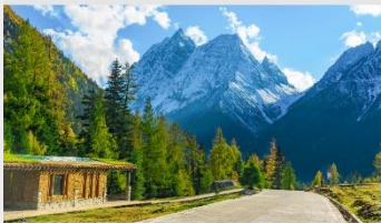
ภูเขาสี่ดรุณี (หุบเขาชวงเจียวโกว)