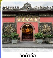
วัดต้าเจ้อ