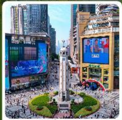
ถนนเจียฟางเป่ย์