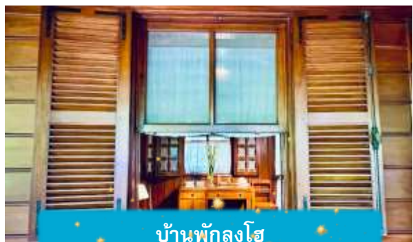
บ้านพักลุงโฮ