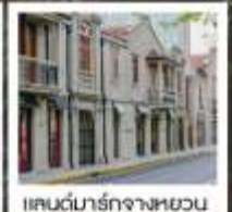
แลนด์มาร์กจางหยวน

เซี่ยงไฮ้ คคลาสสิก ไนท์ / 3 ดึกใหญ่แห่งเซี่ยงไฮ้ คองเรือหมู่บ้านโบราณจูเจียเจียว / EKA Tianwu / วัดหลงหัว แลนด์มาร์ก จางหยวน / ถนนหวยไห่ / ชมโชว์ ERA ที่โรงละครโด่งดังระดับโลก / ซินเทียนตี้