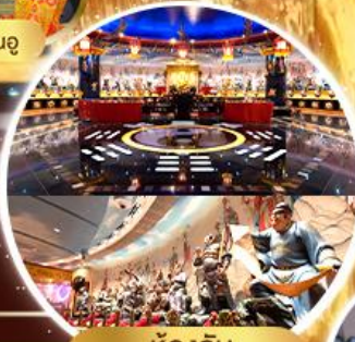
ห้องลับ วัดหวังต้าเซียน

ทริคินี่ พิกย่านแหล่ง Shopping Tsim Sha Tsui , Mong Kok , Jordan