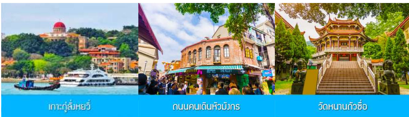
เกาะกู่ลิ่งหยวี

พักที่ โรงแรม XIAMEN HENGLONG HOTEL 4* หรือเทียบเท่าในเซี่ยเหมิน