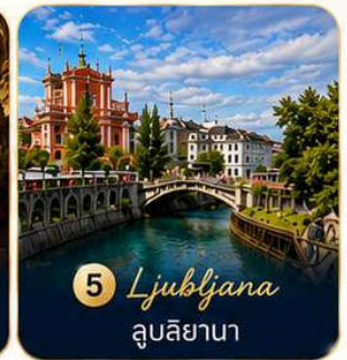
5 Ljubljana ลูบลิยานา