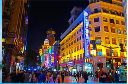
ถนนคนเดินหนานจิงลู่

หลังอาหารนำท่านเดินทางสู่ นครเซี่ยงไฮ้ 上海 (ระยะทาง 210 กม. ใช้เวลาเดินทางราว 3 ชั่วโมง)