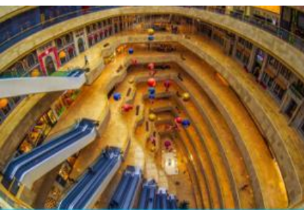
จัตุรัสเต๋อจี

พักที่ โรงแรม Holiday Inn Express Dongshan Hotel 4* หรือเทียบเท่าในนครหนานจิง