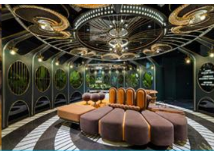
ห้องน้ำไอเทค