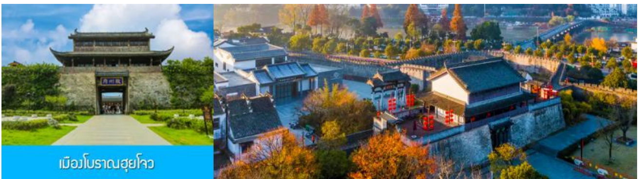
เมืองโบราณซูโจว

จากนั้นนำท่านเดินทางโดยรถบัสสู่ เมืองโบราณซูโจว (ระยะทาง 149 กม. ใช้เวลาเดินทางราว 2 ชั่วโมงเศษ)