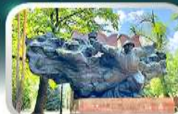
Pantilov Guardsmen Park