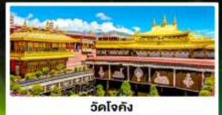
วัดโจกัง