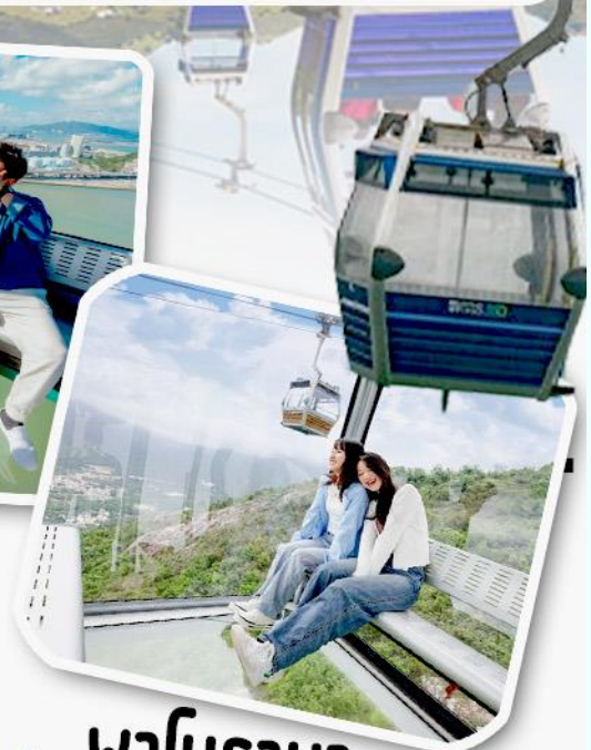
พานิราม่า