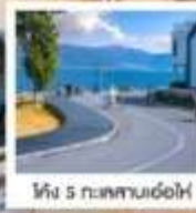
ทะเลสาบ 5 กม. ด้าหลี่