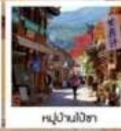
หุบเขาน้ำร้อน