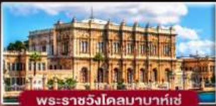
พระราชวังโดลมาบาห์เซ่