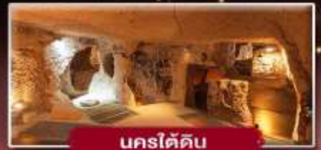
นครใต้ดิน