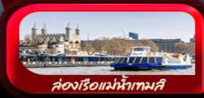
ล่องเรือแม่น้ำเทมส์