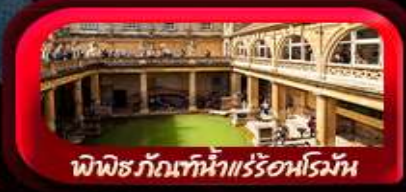
สปาพักผ่อนที่ห้าแคว้นโรมัน

11-17 มี.ค. 69 / 29 เม.ย. - 05 พ.ค. 69 / 14-20 พ.ค. 69 เดินทาง