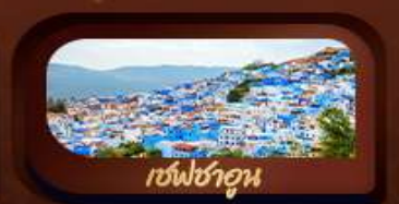
เชฟชาอูน