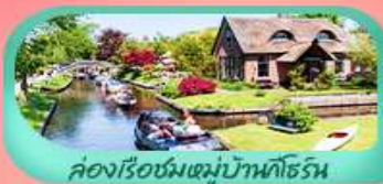
คลองเรือชมหมู่บ้านนิฮอร์น

หนึ่งปีมีครั้ง! ชมเทศกาลดอกทิวลิป สวนเคอเคนฮอฟ Keukenhof 2026 แลนด์มาร์คโดดเด่นมหาวินโดล สพานไออินชอลเลิร์น ล่องเรือชมหมู่บ้านนิฮอร์น ถึงหินลมชาเนสคินส์ คลองอัมสเตอร์ดัม ตื่นตาตื่นใจกับปราสาทราเวนสตีป หอระฆังแห่งกนต์ บริสเซลส์ อะโตเมียม พระราชวังหลวงแห่งบริสเซลส์ เซ็คอินไฮโลท์ ประเทศฝรั่งเศส หอไอเฟล พิพิธภัณฑ์ลูฟร์ ล่องเรือแม่น้ำแซนดูโรแมนติก และช้อปปิ้งจุใจที่ห้างชั้นนำ