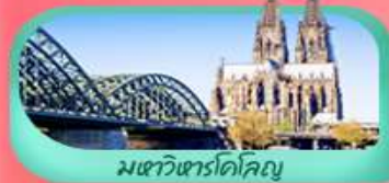
มเขาวินโดล