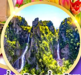
น้ำตกกิ่งกะ-น้ำตกริวเซ