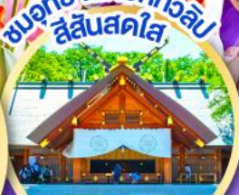
ชมอุทยานดอกทิวลิป สีแสนสดใส