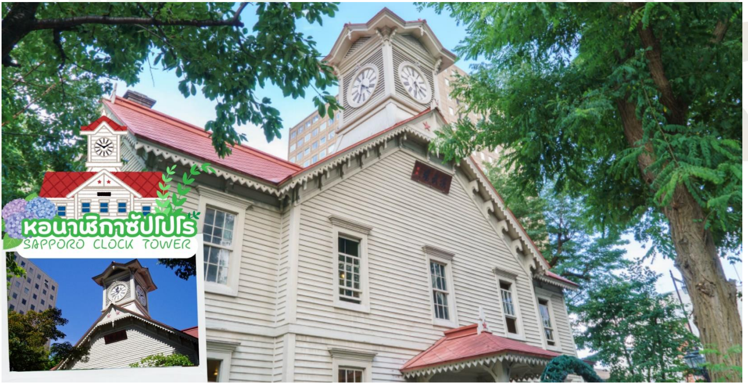
หอนาฬิกาซัปโปโร SAPPORO CLOCK TOWER

ศาลเจ้าฮอกไกโด (Hokkaido shrine) ศาลเจ้าแห่งนี้ตั้งอยู่ที่ซัปโปโร เป็นศาลเจ้าศาสนาพุทธนิกายชินโตถือเป็นศาลเจ้าที่มีความเก่าแก่แห่งหนึ่งในเกาะฮอกไกโด ถูกสร้างขึ้นในปี ค.ศ. 1871 ในปัจจุบันก็ยังคงมีความเกี่ยวข้องกับวิถีชีวิตของชาวฮอกไกโดอย่างลึกซึ้งซึ่งเริ่มตั้งแต่การมาสักการะในวันปีใหม่ การปิดเป่ารังควาญ วันเซ็ตสึบุน พิธีสมรสและอื่น ๆ เป็นต้น ในเขตศาลเจ้าที่มีธรรมชาติอุดมสมบูรณ์ มีกระรอกป่ามาเยี่ยมทักทาย และจะคราคร่ำไปด้วยนักท่องเที่ยวที่มาชมดอกซากุระและดอกบ๊วยซึ่งจะบานสะพรั่งพร้อม ๆ กันเมื่อฤดูใบไม้ผลิมาเยือน