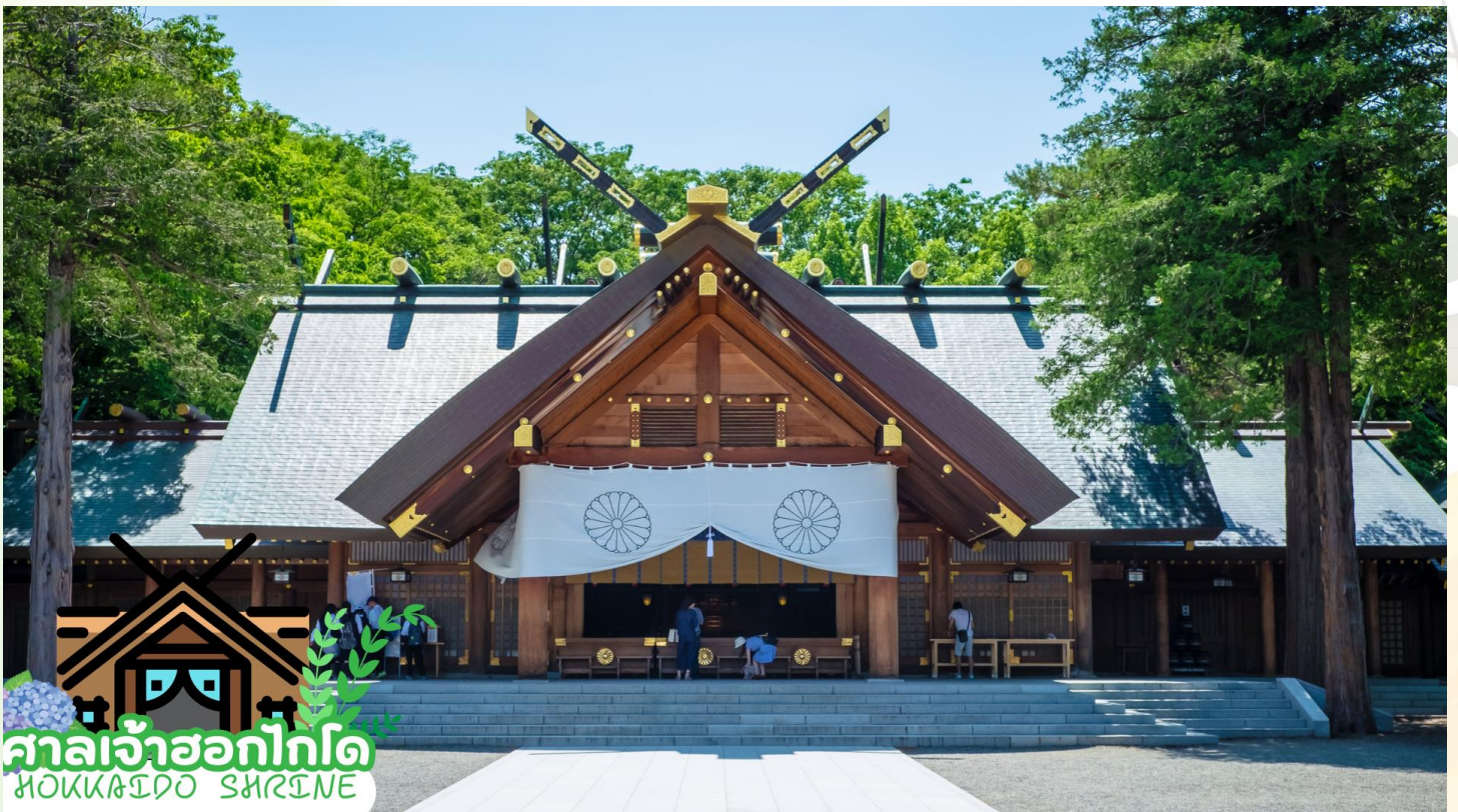
ศาลเจ้าฮอกไกโด HOKKAIDO SHRINE

ศาลเจ้าฮอกไกโด (Hokkaido shrine) ศาลเจ้าแห่งนี้ตั้งอยู่ที่ซัปโปโร เป็นศาลเจ้าศาสนาพุทธนิกายชินโตถือเป็นศาลเจ้าที่มีความเก่าแก่แห่งหนึ่งในเกาะฮอกไกโด ถูกสร้างขึ้นในปี ค.ศ. 1871 ในปัจจุบันก็ยังคงมีความเกี่ยวข้องกับวิถีชีวิตของชาวฮอกไกโดอย่างลึกซึ้งซึ่งเริ่มตั้งแต่การมาสักการะในวันปีใหม่ การปิดเป่ารังควาญ วันเซ็ตสึบุน พิธีสมรสและอื่น ๆ เป็นต้น ในเขตศาลเจ้าที่มีธรรมชาติอุดมสมบูรณ์ มีกระรอกป่ามาเยี่ยมทักทาย และจะคราคร่ำไปด้วยนักท่องเที่ยวที่มาชมดอกซากุระและดอกบ๊วยซึ่งจะบานสะพรั่งพร้อม ๆ กันเมื่อฤดูใบไม้ผลิมาเยือน