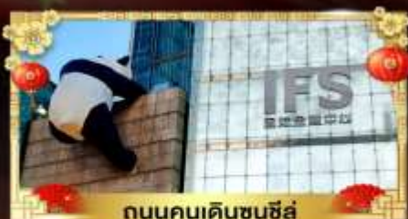
ถนนคนเดินชุนซีอู๋

เที่ยวอุทยานสวรรค์ระดับ 5A จิวจ้ายโกว "กู๋เขาสีดรุณี" อุทยานชื่อดังเหนียงชาน